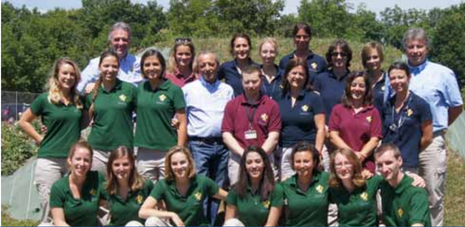
L'équipe de la CLINEQUINE - Eté 2015

Depuis de nombreuses années, nous avons tenu à ce que les différents intervenants au sein de la clinique revêtent des tenues spécifiques en fonction de leur rôle. Vous pouvez donc avoir comme interlocuteur :